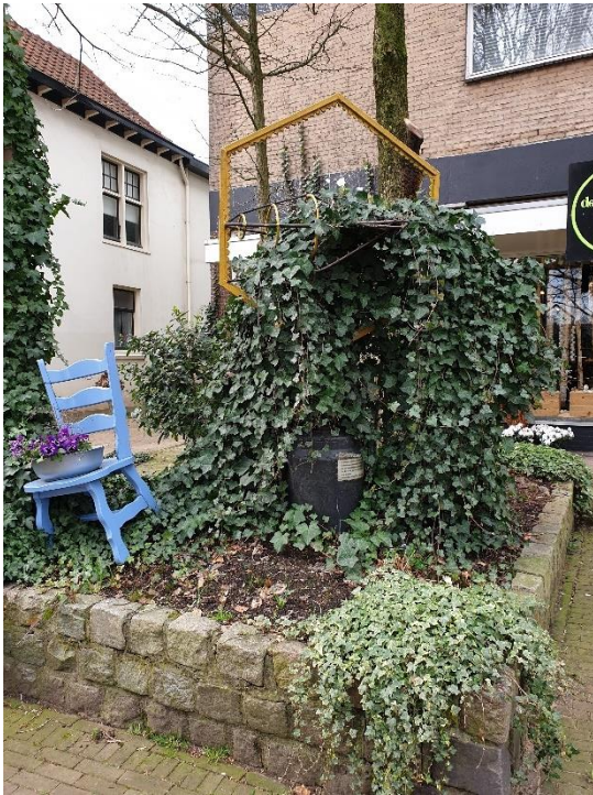
Bijenmonument Europalaan Renkum Onderhoud wordt verwaarloosd.

Zorgvuldig omgaan met gemeentelijk bezit, onderhoud en herstel