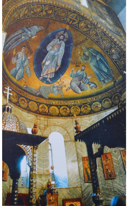
Het klooster, de Mozesberg, wandelingen, op bezoek bij dorpsbewoners.