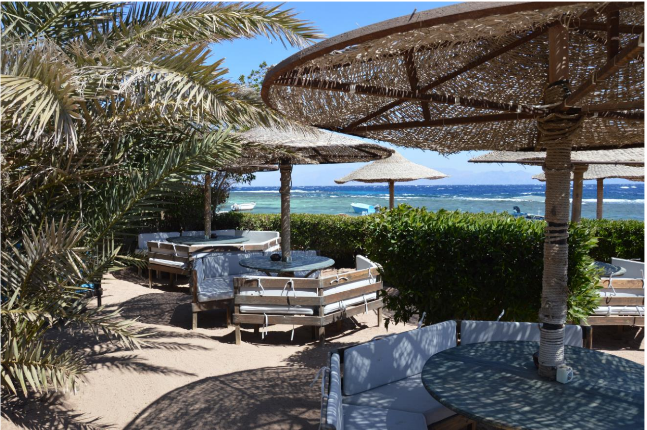
Dahab: flaneren, winkelen, koffie drinken & lekker eten