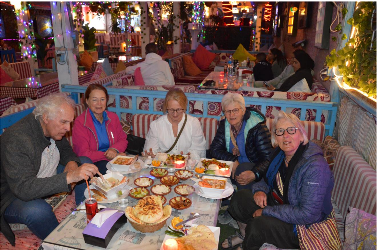
ma'a salâma / tot ziens